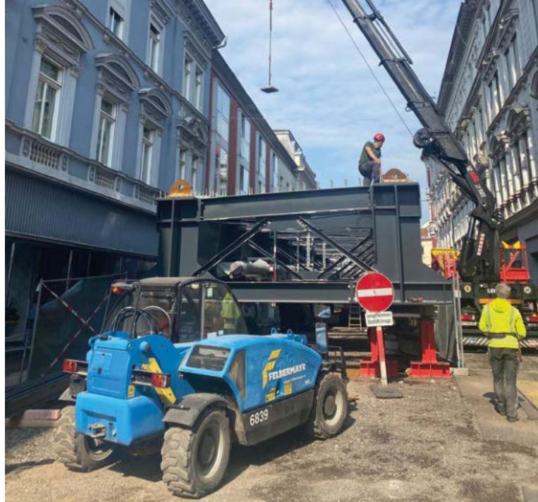
Die Stahlkonstruktion für den nördlichen Teil der Tegetthoffbrücke – in der Belgiergasse war ein Vormontageplatz eingerichtet.