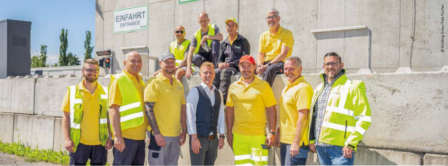
Team der Holding Graz Abfallwirtschaft am Standort Neufeldweg/Maggstraße