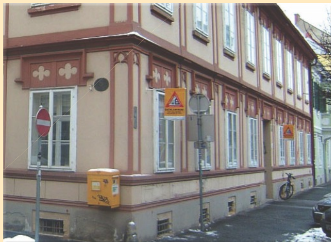
Der Verband der Versicherungsunternehmen Österreichs unterstützt den Ersatz von gefährlichen Warnstangen durch Dachlawinen-Warnfahnen.

Die Dachlawinen-Warnfahne des BSVSt dient der Erfüllung der gesetzlichen Warnpflicht von Gebäudeeigentümern und unterliegt dem europäischen Geschmacksmusterschutz.